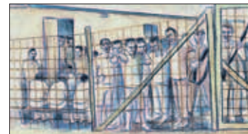
Bij gebrek aan foto's heeft de Seoc historische schetsen laten maken om het een en ander nadrukkelijk te illustreren. Hier een tekening van de opsluiting van de Chinezen in kamp-Sufficient.