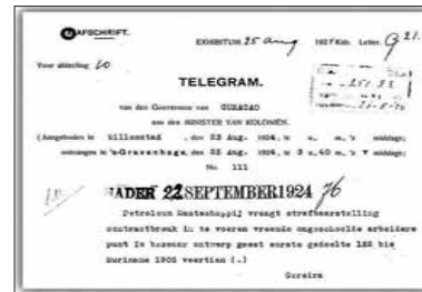
De petroleummaatschappij vraagt strafbepaling aan bij contractbreuk.